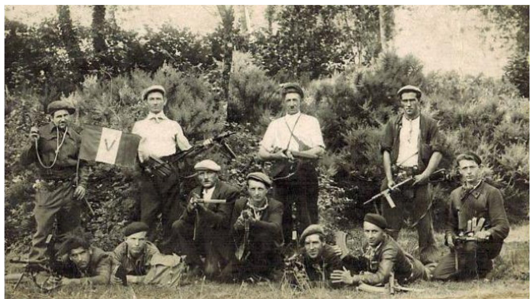
Un groupe de résistants photographié pendant l'été 1944.